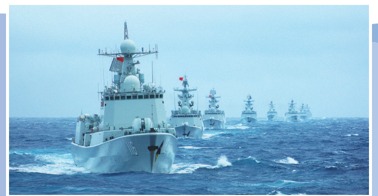
2014年12月12日，执行远海实战化训练任务的海军石家庄舰编队组织编队机动训练