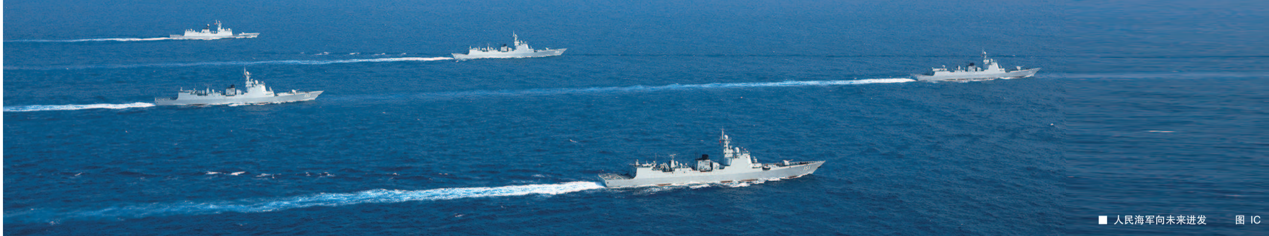
人民海军向未来进发 图 IC

人民海军成立七十周年多国海军活动海上阅兵今天在青岛举行。青岛附近水域今天海况良好，气象条件较为合适。据悉，海上阅兵除中方参阅兵力外，俄罗斯、泰国、越南、印度等十多个国家的近20艘舰艇参加检阅活动，包括驱逐舰、护卫舰、登陆舰等不同类型舰艇。中国海军副司令员邱延鹏表示：“它们都是各国海上力量的代表，将与中方舰艇一道，向世界展示维护和平、共谋发展的坚定决心。”