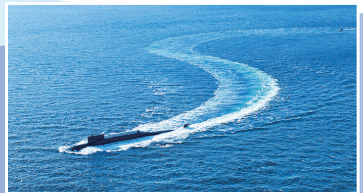
海军某新型战略核潜艇向某海域航渡