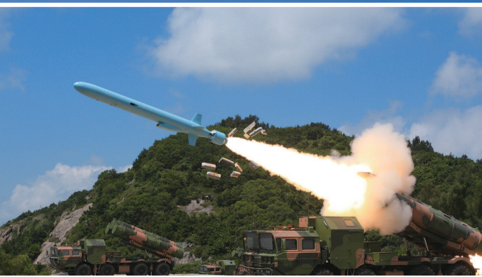
2013年7月10日，海军某部组织进行机动岸舰导弹实弹射击训练