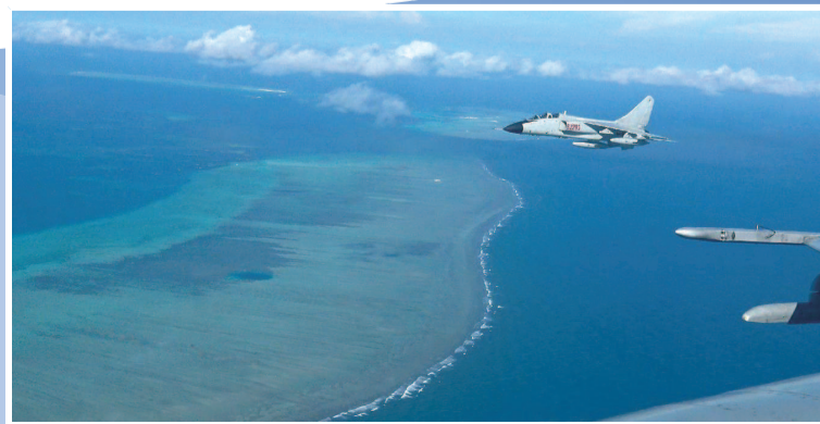
2017年3月19日 南海舰队航空兵某飞行团组织“飞豹”对我南海岛礁进行巡航