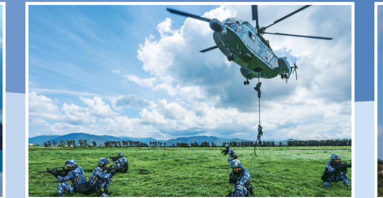
2017年6月26日，“蛟龙突击队”队员在某训练场组织进行直升机滑降训练