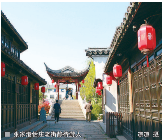
张家港恬庄老街静待游人

出境游方面,短线游依然唱“主角”,泰国、菲律宾等东南亚海岛游和日本踏青游成为大热门。此外,法国、澳大利亚、美国和马尔代夫也热度不减。沈琦华