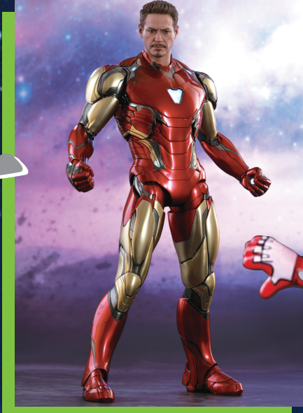
▲ 最新复联4钢铁侠1:6人偶