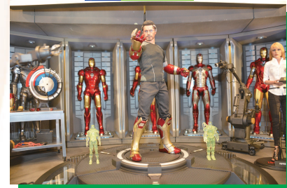
▲ 钢铁侠套装