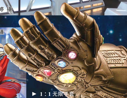
▶ 1:1 无限手套