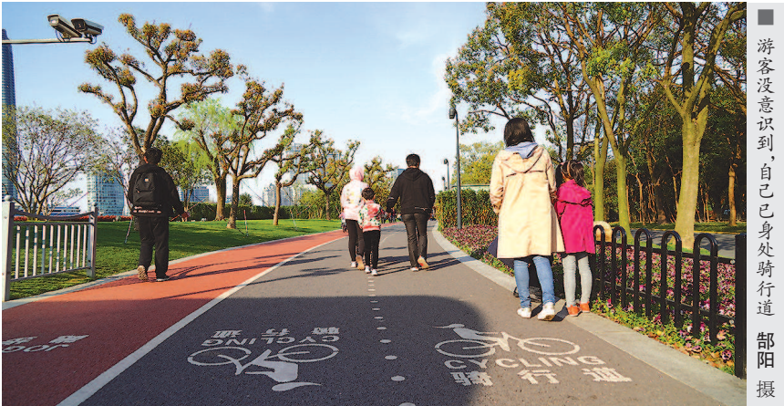
游客没意识到,自己已身处骑行道

没有了雨水打扰,市民纷纷外出踏青。昨天下午,陆家嘴北滨江绿地游人如织,黄浦江畔,大家享受着亲近自然的美好。 “丁零零”,一阵不耐烦的车铃打破了平静,看着散步的行人,自行车运动发烧友摇了摇头,只能放慢速度。“吡”,尖锐的刹车声传来,突然窜出的小男孩吓了车主一跳,幸好反应及时,没有酿出事故。“旅行团的朋友们请跟我来,大家看到那边的环球金融中心了吗?”另一边,大群游客在导游的指引下欣赏着城市风光,不时举起手机拍照留念,丝毫没有察觉已经占用了骑行道。站在一旁的保安似乎见怪不怪,并没上前劝阻。 去年,上海滨江两岸 45 公里全线正式宣告贯通,滨江沿线从杨浦大桥延伸至徐浦大桥。浦东滨江段是其中风景最好的一条骑行道,吸引了大量中外公路车爱好者在此骑行。浦东新区政府网站上显示,陆家嘴北滨江绿地自行车骑行道总长度约 1530 米、跑步道总长度约 1540 米,其中相当一段两道并行。该批复还写道,做好标识设置,其中跑步道应标识为 1 号绿道。