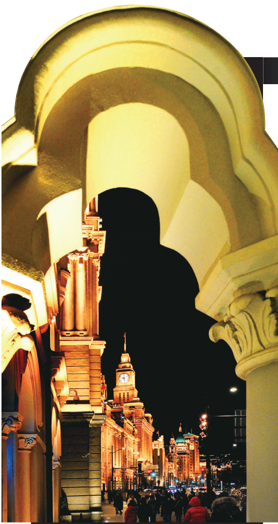
▲ 外滩万国建筑群