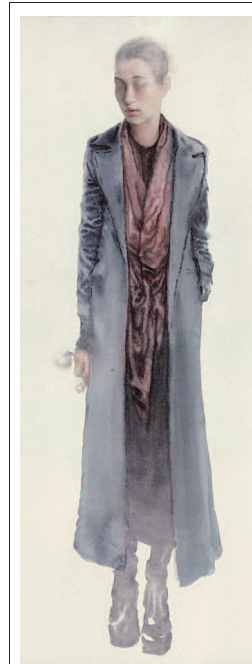
逆光的肖像 (水彩画) 应金飞

现在的孩子普遍抗挫折能力不足,虽然有娇生惯养的客观原因,但也与父母、祖辈过度呵护有关。在祖辈带孙辈的场合,时常看到爷爷奶奶为孙子孙女当“配音演员”的情形。如孩子不小心摔倒,其实并没有受伤,甚至没有多大疼痛,爷爷奶奶见状,如同发生“特大事件”,连连问“摔痛了吗?”在祖辈的诱导之下,孩子的哭闹随之而起,表面上看是