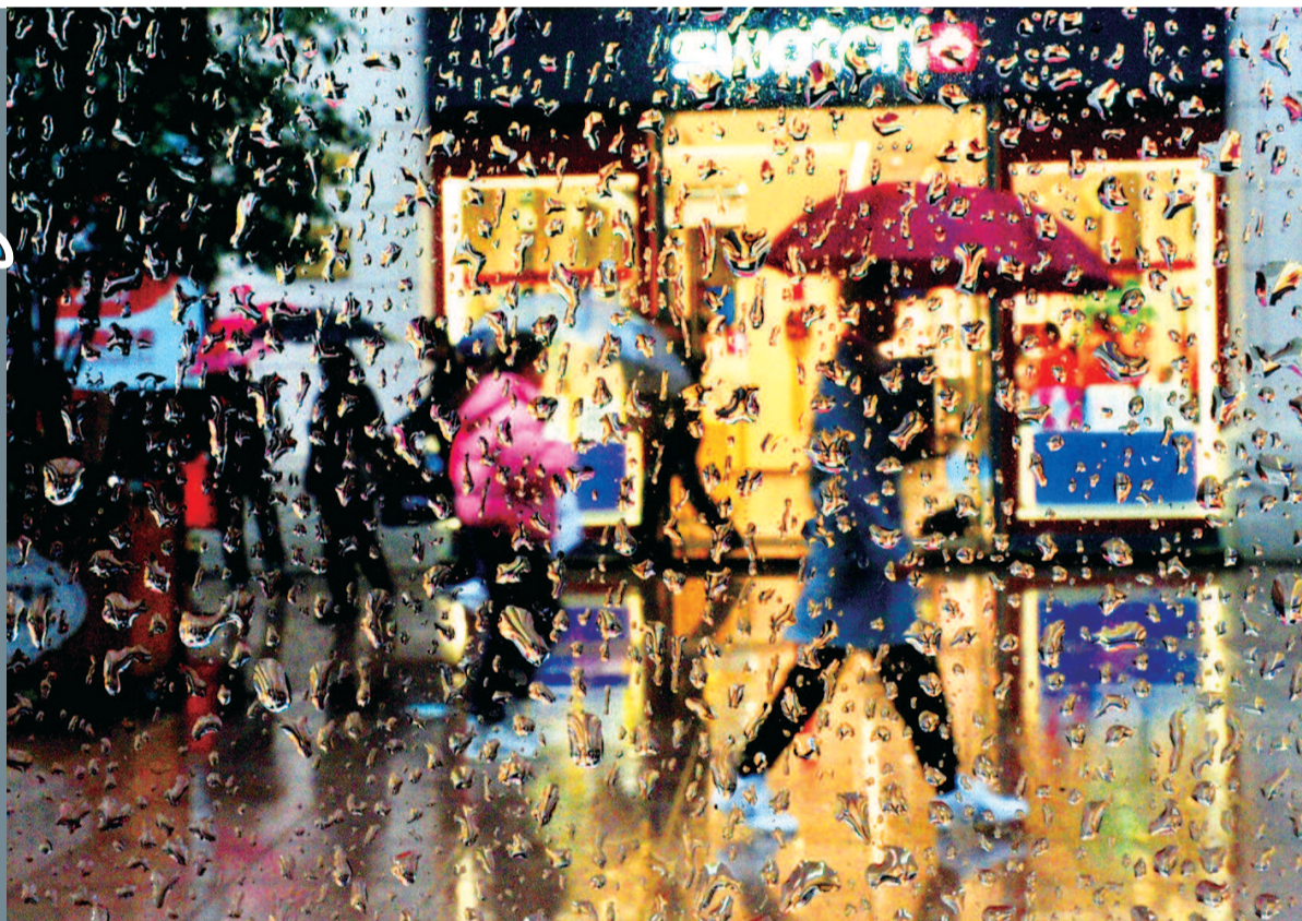
南京路步行街上,路人在雨中步履匆匆