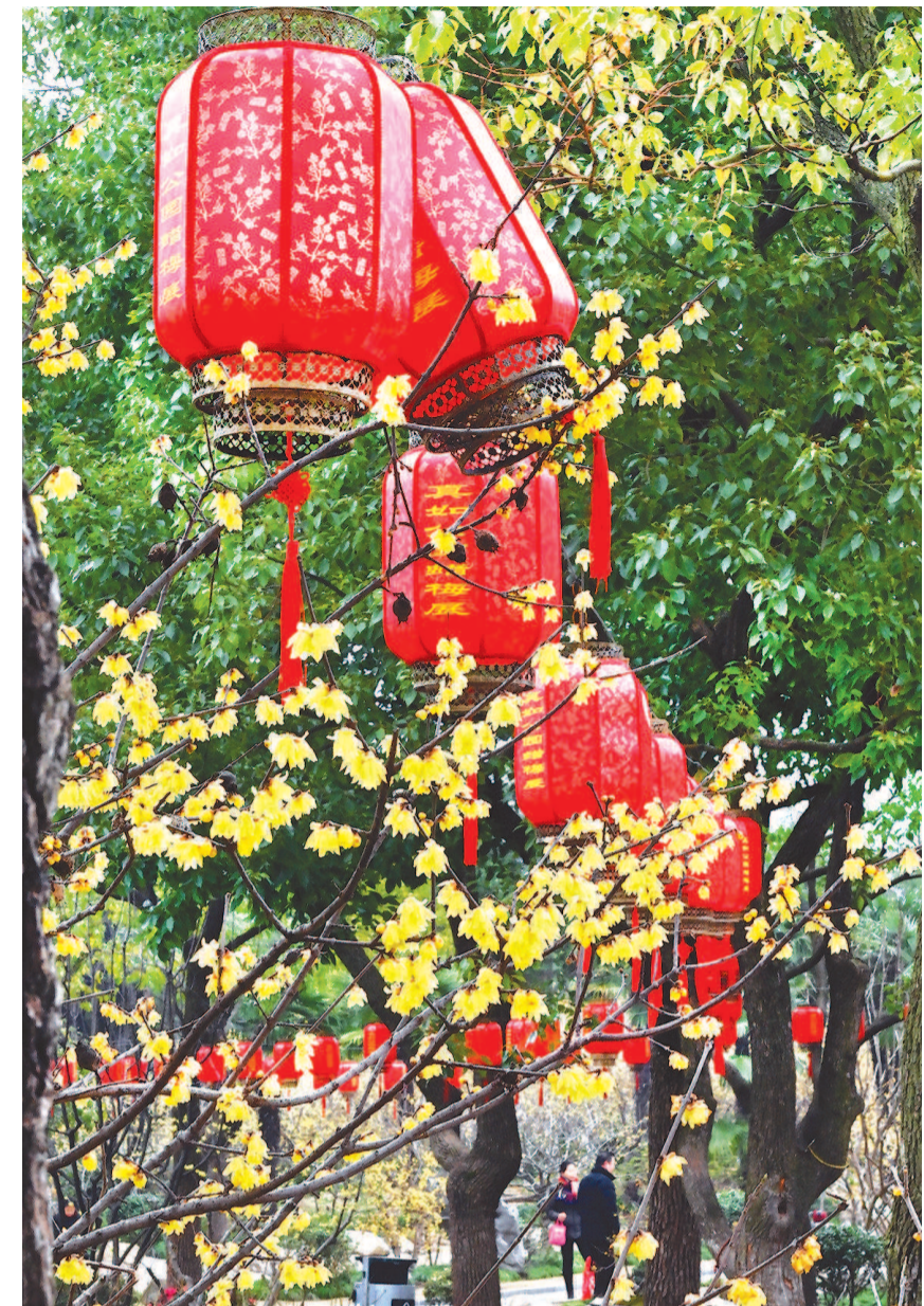
真如公园内的蜡梅与火红的灯笼营造出浓浓的新春气息