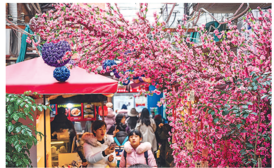
梅花之美,让其成为节日里的最佳布景