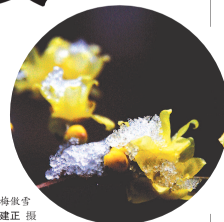
蜡梅傲雪

在梅花盛开的时候,“开时寒冬落时春”的蜡梅,则绽放着最后的美丽。蜡梅属于蜡梅科蜡梅属,其实与梅并非同一种花,但由于花期相