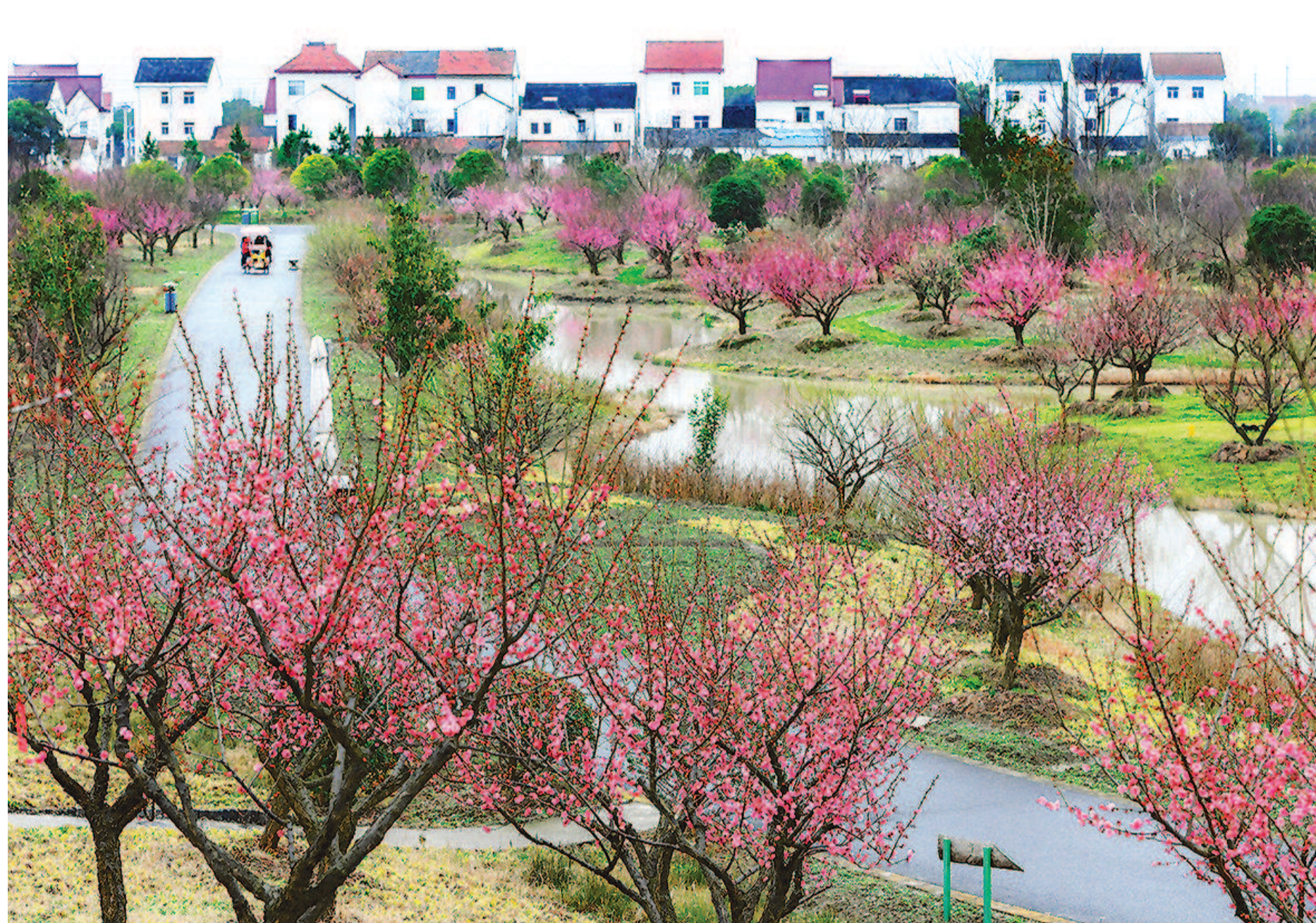
金山区花开海上生态园内,大片的梅林与小溪、村庄形成一幅美丽的田园画