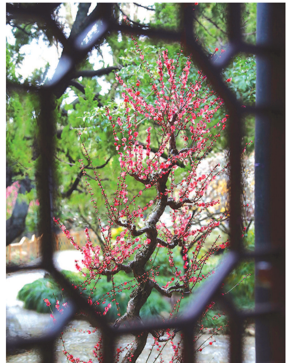
古猗园内,传统的梅花盆景造型打造出一片古意