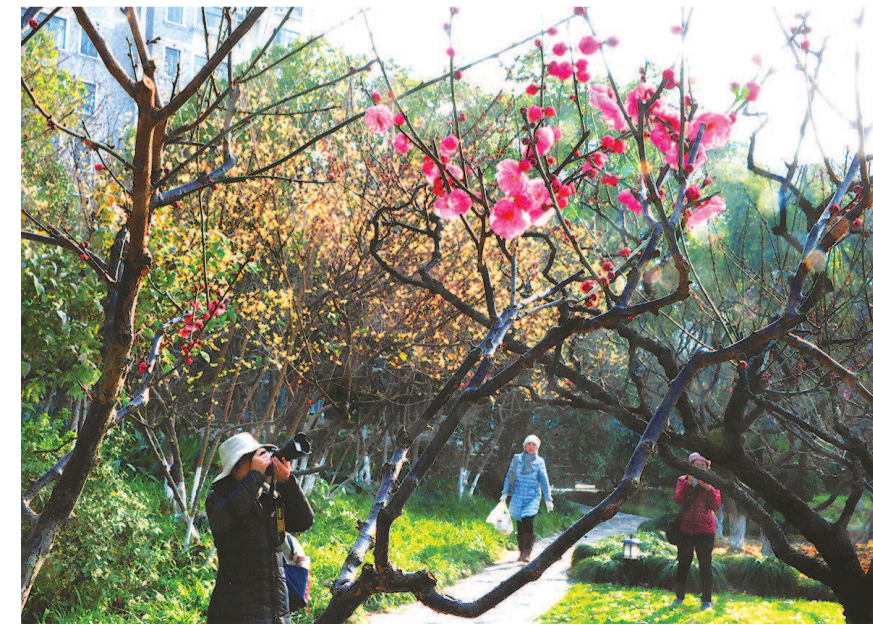
莘庄公园内艳丽的红梅与鹅黄的蜡梅双梅同开