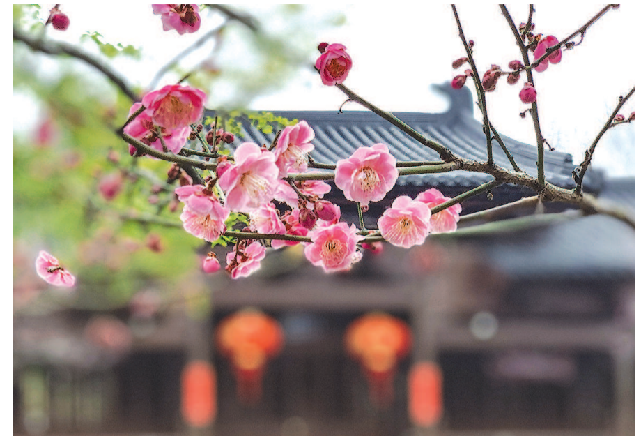
松江广富林遗址公园内梅花陆续开放