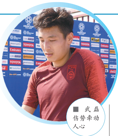
■ 武磊 伤势牵动人心