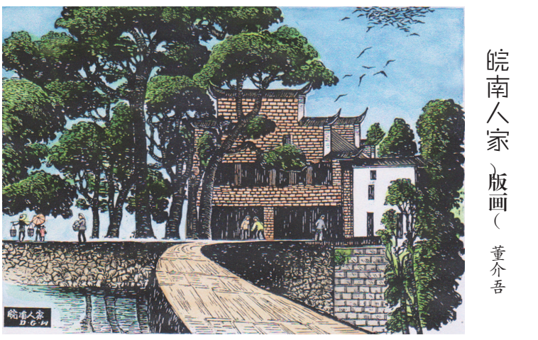
皖南人家 版画 董介吾