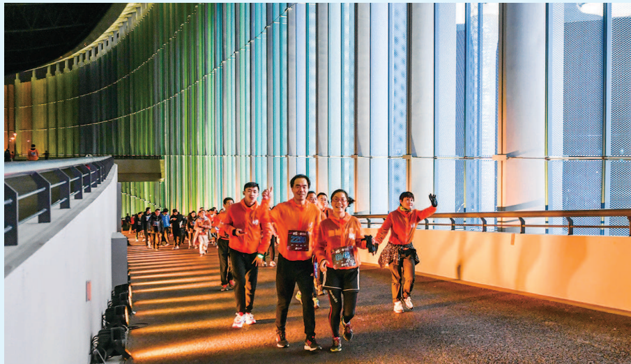
■ 包括首届进博会参展商、志愿者、媒体及博览会服务保障人员在内的四千多人参加了跨年跑