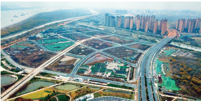
■ 南京江北“青龙玉带”上要建 5 个主题公园