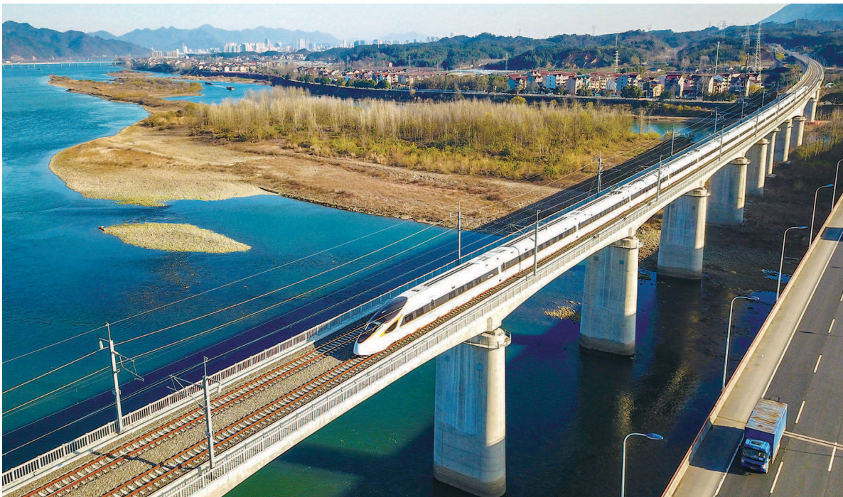
■ 杭黄高铁驶过富春江