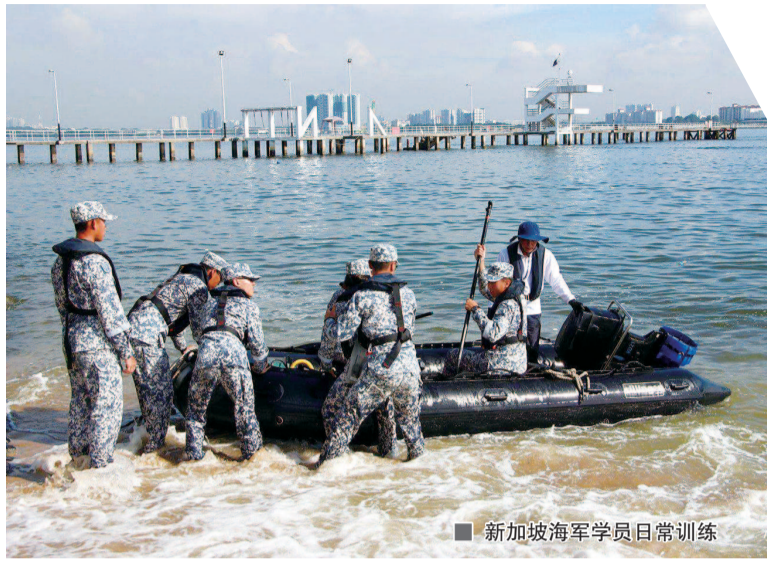
■ 新加坡海军学员日常训练