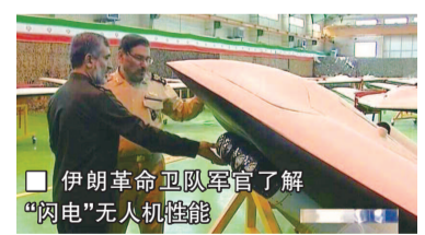
■ 伊朗革命卫队军官了解“闪电”无人机性能

据美国《防务世界》报道，伊朗革命卫队空军司令哈吉扎德准将最近透露，“今年以来，国产无人机用制导炸弹对极端组织‘伊斯兰国’进行700多次军事行动，敌人大量装甲车辆、自爆汽车和小口径高炮被摧毁，我们在很大程度上扭转了战局。”哈吉扎德还称，近期伊朗无人机重点打击位于叙利亚代尔祖尔省哈金镇的“伊斯兰国”总部，这是伊朗首次承认其在叙利亚直接参与作战，而且相关画面显示，伊朗人甚至动用了隐形无人机，这在中东战争史上也是首次，此举也让外界对伊