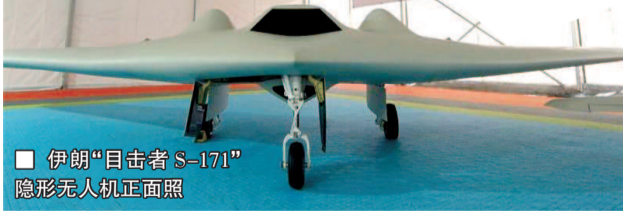
■ 伊朗“目击者 S-171”隐形无人机正面照