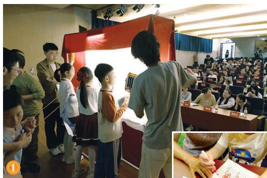
与症状疗愈的双重目标。

今年是东华大学环境学院关爱孤独症儿童志愿服务走过的第十个年头，5月16日下午，来自上海松江星悦儿童成长服务中心的“星星的孩子”、上海市松江区九里亭外国语实验学校的小学生志愿者家庭，与东华大学环境科学与工程学院大学生志愿者相聚校园，开展别开生面的融合活动。