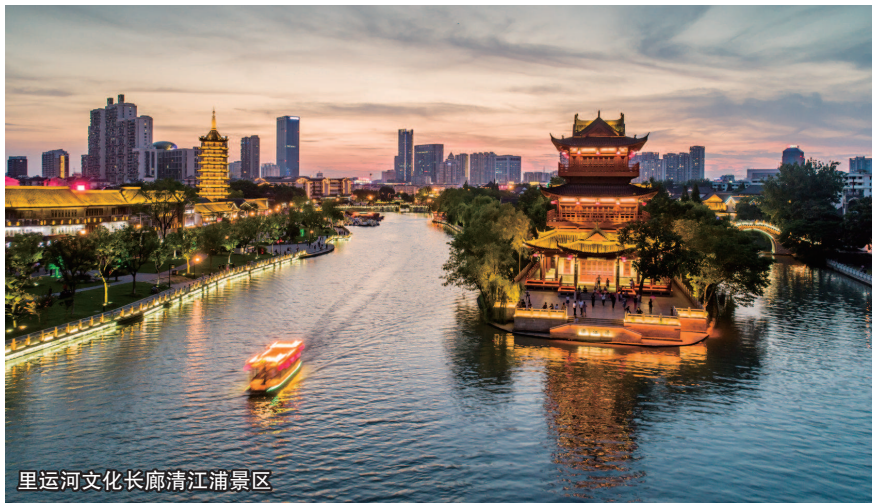
里运河文化长廊清江浦景区

4月17日至19日，“长三角媒体看淮安”的记者们齐聚运河名城淮安，开展集中采访采风活动。三天时间内，媒体采风团深入淮安市下辖清江浦区、淮安区等区的运河景点、历史古镇、遗址遗迹等采风调研，记录淮安的运河基因、山水之美和美食风情，展示淮安独特的人文历史和景观魅力，不断提升淮安文旅品牌的知名度、美誉度。