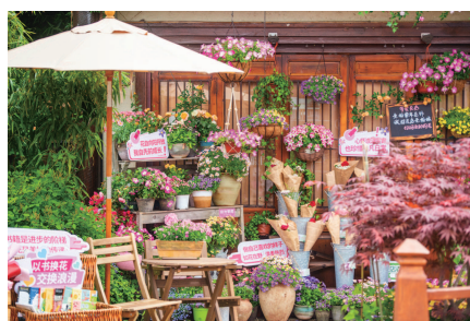
无锡拈花湾“无人售卖花店”

漫步无锡拈花湾景区,游客可以观赏到万亩花海,时下绣球花、虞美人、蔷薇等多种花卉正在竞相开放。为了营造精细化、多层次的旅游体验,避免“走马观花”,景区新增了十多处大型花景艺术打卡点,打造将持续半年的“为你花开满城”主题品牌,开启精致赏花模式。除了赏花外,景区持续做好“花”文章,新添了无人售卖鲜花店。店内各种花束都标注有价格,