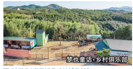
梦也童话·乡村俱乐部