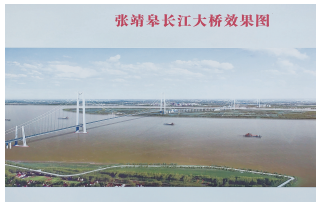
张靖皋长江大桥效果图