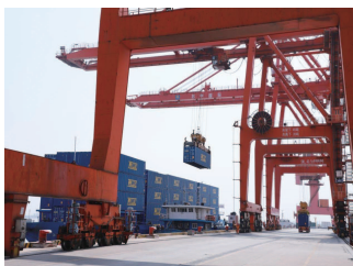
近日,益嘉9粮食船安全停靠

在苏中国际码头进行装卸作业,多条作业线齐头并进,展现出一派繁忙景象。这是益海嘉里集团首次与如皋市交通产业集团如皋港板块苏中国际码头开展合作,也是苏中国际码头继与中国小麦粉加工企业50强的东皖穗丰粮食集团有限公司合作后的又一深度合作。