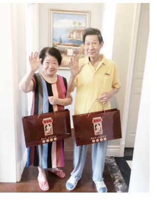
翔玮社区服务中心为老人送上定制靠枕

2022年,在上海经历了封城之后,中心在往年的防暑降温礼包内增加了酒精消毒喷雾、免洗消毒液等防疫物资。中秋节为服务对象送上月饼已成为中心每年的惯例,收到月饼礼盒的老人脸上洋溢着笑容。