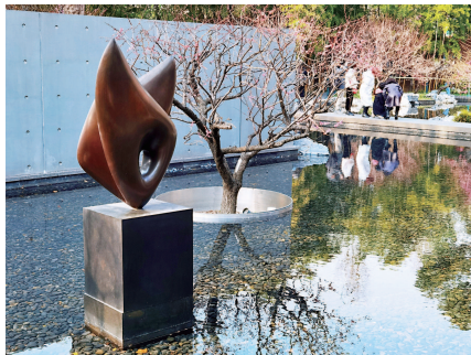
静安雕塑公园梅园“水中倒影”

城郊松江区的可赏梅花的公园有多处。可带游客“穿越”古今看梅景的广富林文化遗址内,株株梅花正凌寒开放,“红梅映青瓦,白水绕人