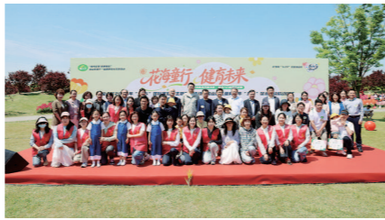
花海童行活动现场照片

活动聚焦儿童青少年“五健”促进行动和婴幼儿早期发展服务,区妇幼所、区精中心、区牙防所等专业机构和区教育局早教中心分别开设了健康科普集市专区和亲子互动专区,通过寓教于乐的活动,提高家庭科学育儿能力。健康科普集市专区通过发放科普手册、现场答疑解惑、免费健康筛查等多种形式,向市民普及优生优育、科学育儿、体重管理、护眼护牙、心理疏导等健康知识,解读生育支持惠民政策;亲子互动专区针对不同年龄段幼儿成长特点,精心设计趣