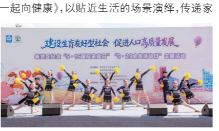
奉贤区活动现场照片

在青村镇李窑村芳华书院大草坪活动现场,青村镇明德外国语小学的孩子活力四射,用动感十足的健美操表演点燃现场氛围;青村镇爱卫办创新改编经典歌曲《童年》,带来乐器弹唱节目《健康家之四害拜拜》,将病媒防治知识巧妙融入熟悉旋律,让大家在轻松愉悦的歌声中学习健康技能;柘林社区卫生服务中心精心编排的家庭医生情景剧《全家动起来,一起向健康》,以贴近生活的场景演绎,传递家