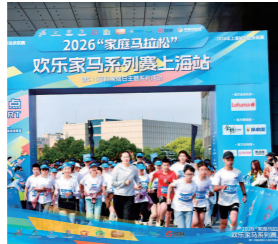
家庭马拉松活动现场照片