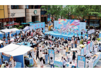
徐汇区活动现场照片

启动仪式上,徐汇区卫生健康委正式发布了全新打造的“徐汇区婚孕一体化服务专区”便民平台,居民只需通过健康云App或健康云Pro小程序,即可轻松预约免费婚前医学检查与免费孕产优生健康检查。该系