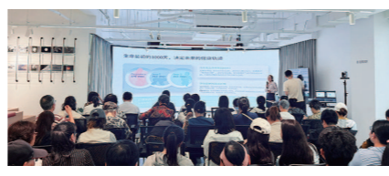
静安区活动现场照片

作为静安区“爱在静安·健康随行”项目的开篇之作,本次讲座不仅带来了科学的健康知识,还进一步提升了全社会对生育友好型社会建设的关注度与支持力度。