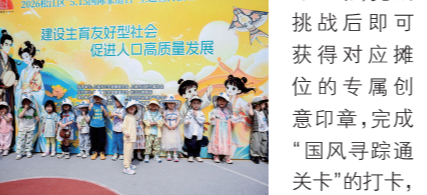
松江区活动现场照片

当天活动在松江区托幼服务指导中心开展,由亲子互动健康操拉开序幕,家长与孩子携手律动,欢快的节奏迅速点燃现场氛围,随后,每组家庭开始有序地“游园集章”,前往活字印刷体验、传统漆扇制作、纸艺制作、投壶游戏、儿童充气城堡、古风妆造体验等6个特色点位参与活动,完成挑战后即可获得对应摊位的专属创意印章,完成“国风寻踪通关卡”的打卡,