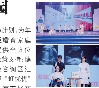
虹口区活动现场照片

障计划,为年轻婚育家庭提供全方位政策支持;健康咨询区汇聚“虹优优”生育友好文创展示、区妇幼所母婴健康服务等实用宣传摊位,同时还有智慧养老相关企业带来各类智能检测产品;非遗漆画扇体验吸引小朋友驻足参与体验。