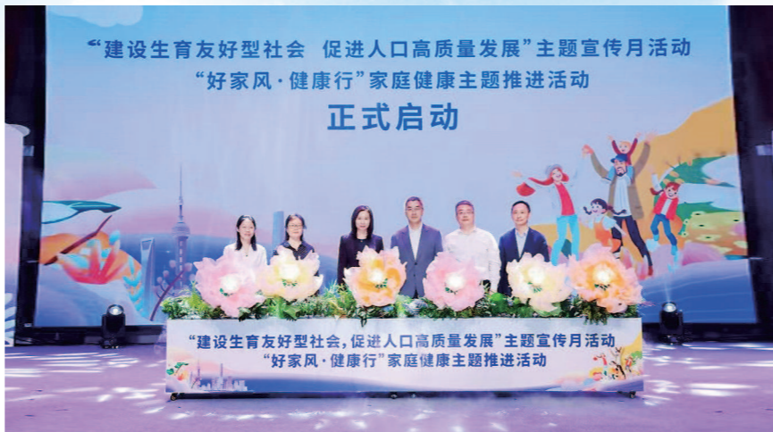
“建设生育友好型社会 促进人口高质量发展”主题宣传月活动“好家风·健康行”家庭健康主题推进活动正式启动