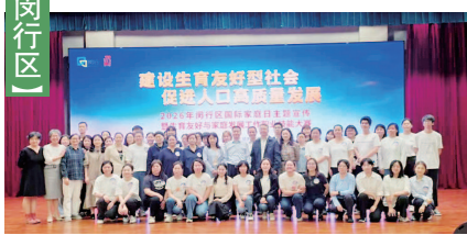
以赛促学活动现场照片

近年来,闵行区深入贯彻落实国家和上海市相关部门部署,扎实推进育儿补贴、托育服务、医疗保障、母婴设施建设等生育友好支持举措,持续推动建设生育友好型社会。