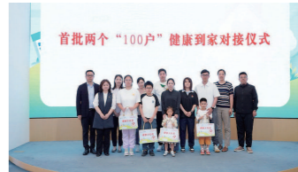
普陀区活动现场照片

5月17日,普陀区妇联、区卫健委、区文明办、区委社会工作部、区教育局共同开展“AI点亮‘家’幸福 健康赋能筑未来”2026年普陀区国际家庭日暨家庭教育宣传周主题活动。活动现场,区卫健委启动“千家万户+健康”项目,项目聚焦“优生优育、科学育儿、青春健康、生殖健康”四大板块,将成立专家团队,在“十五五”期间,走进各类家庭普及健康科普知识,提高家庭健康素养。现场,甘泉卫生、长征社区卫生率先开展首批两个“100户”健康到家对接工作,为4户家庭代表赠送健康大礼包。