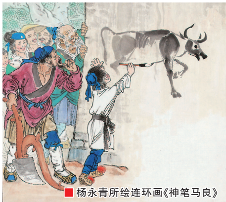
杨永青所绘连环画《神笔马良》