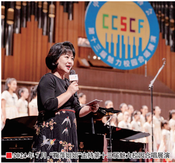
2024 年 7 月, “鞠萍姐姐”主持第十三届魅力校园合唱展演