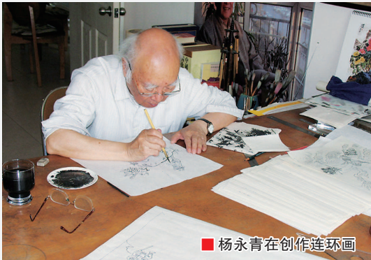
杨永青在创作连环画

杨永青一生笔耕不辍, 留下 220 余册连环画、上千幅插画, 包括《神笔马良》《王二小》等力作。今年恰逢洪汛涛所创作的童话故事《神笔马良》发表 70 周年, 杨永青画笔下的马良形象此次回到他的故乡, 勾起几代读者的童年回忆。