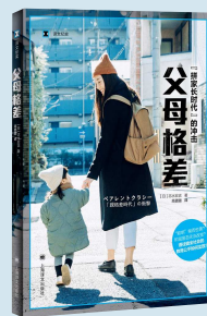
书名:《父母格差》 作者:〔日〕志水宏吉 译者:高璐璐 出版社:上海译文出版社