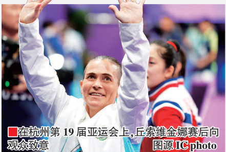
在杭州第19届亚运会上,丘索维金娜赛后向观众致意

12万欧元,那相当于乌兹别克斯坦普通家庭100年的收入。”多年后她回忆时,眼中仍泛着泪光。