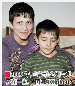
2009年,丘索维金娜与儿子在一起

7岁开始练习体操,从巴塞罗那奥运会的青涩少女到洛杉矶奥运周期的中年母亲,丘索维金娜用34年职业生涯书写着体育史上最动人的篇章。