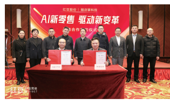
▲红豆股份(600400.SH)与酷店掌签约战略合作

当前,全球数字化变革浪潮翻涌,服装零售行业正经历深刻变革。在品牌纷纷加码线下门店、重塑零售体验格局的背景下,红豆股份(600400.SH)与酷店掌于1月11日携手签约战略合作,锚定“AI新零售驱动新变革”这一前沿主题,协力构建“舒适红豆”门店全生命周期管理新生态。双方的此次联合行动,仿若一颗重磅石子投入行业湖面,迅速吸引了众多业内人士的目光。