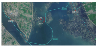
▲窑湾码头—大运河—骆马湖水上游航线

在水上游览线路打造方面，新沂利用大运河及骆马湖水资源优势，编制了《窑湾骆马湖水上游航线规划方案》，加大对骆马湖水面和湖心岛资源开发，打造集观光游、体验游、水上巴士等功能于一体的水上特色旅游。