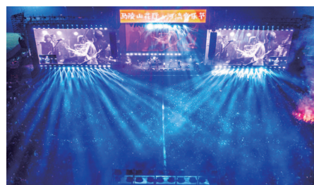
▲马陵山第二届花厅音乐节