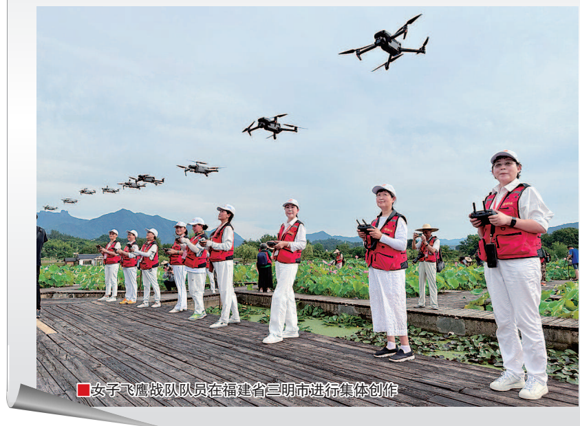
女子飞鹰战队队员在福建省三明市进行集体创作