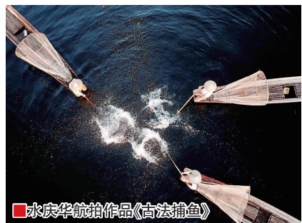
水庆华航拍作品《高法捕鱼》