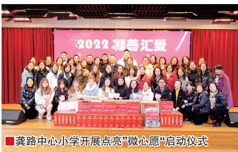
龚路中心小学开展点亮“微心愿”启动仪式

教师团队的文明和谐必定会潜移默化地影响自己所带的学生。在龚小就是如此,德育入心,成德于行,教师的文明理念、言行、处事方式,无时不在熏陶、优化着学生的成长。2020年,学校被评为全国生态文明示范校和新区未