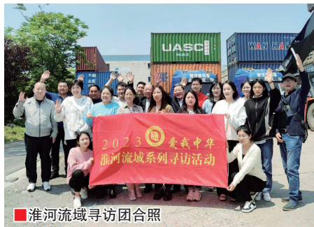
淮河流域寻访团合照

作者曾先后十多次在淮河中下游、江南地区进行田野考察,同时也广泛研究历史文献,与同行专家切磋交流,本书即是作者在这一区域探索和