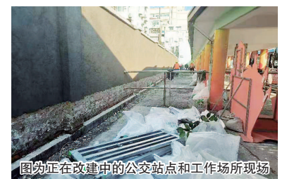
图为正在改建中的公交站点和工作场所现场

改造后的劳模工作室重新划分了各项功能区域。结合了劳模风采、现场授课经验、人才培养经验等的简介区；展示786路公交车的昨天、今天、明天的公交历史小小博物馆区；展示劳模工作室荣誉的荣誉区；建立职工书屋，让来到劳模工作室的人能看书学习；建立文娱场地，在劳模工作室的健身房内配备了划船器、健身车、椭圆机等健身设施，丰富工作成员的业余生活，增进各成员之间的交流，进一步提升职工的文化生活水平。用爱服务一线员工，用心体现劳模示范引领作用。