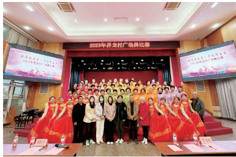
源源不断的内在动力。

一花独放不是春，百花齐放春满园。通过此次文明实践活动，大家互相学习、交流提升，倡导了快乐运动、健康生活的理念，共同推动了村民自治文化团队的开展，促进了界龙村精神文明建设蓬勃发展。