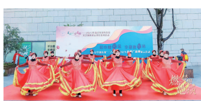
安亭镇妇联将继续团结各级妇联组织，带领广大妇女群众以更加坚定的信心、更加饱满的热情、更加昂扬的姿态，为安亭国际汽车智慧城市建设贡献巾帼力量。

此次主题活动共分为《阅她·不凡》《悦她·不凡》《越她·不凡》三个篇章，展现了过去一年安亭女性在组织建设、疫情防控、巾帼建功、权益保障、巾帼关爱、家庭文明等方面的突出贡献与先进作为。