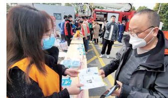
觉远离毒品、抵制毒品，做文明守法公民。

此外，平安志愿者们还深入园区企业，面向企业员工开展“面对面”平安宣传。平安志愿者们详细介绍了毒品的种类、特征、成瘾性和吸食后的反应，并重点讲解了新型毒品的识别方法及吸毒对自身、对家庭、对社会造成的严重危害等禁毒知识。同时，告诫员工们要时刻保持对毒品的警惕性，不要随意接受陌生人提供的香烟、饮料及食品，不要进入KTV、酒吧等治安情况复杂的场所，面对毒品的诱惑，必须坚决抵制，绝不能尝“第一口”。企业员工也纷纷表示受益匪浅，愿意积极参与禁毒工作，自