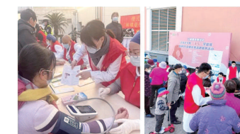
召居民树立“每个人是自己健康第一责任人”的意识，提高辖区居民健康生活质量，促进社区和谐发展。

为进一步深化浦东卫生健康系统新时代文明实践志愿服务和学雷锋志愿服务内涵建设，大力弘扬志愿服务精神，助力浦东新区引领区建设以及全国文明典范城区创建，浦东新区迎博社区卫生服务中心19名党团员青年志愿者于2023年3月3日上午9时在三林镇市民中心广场和永泰路1892号服务点开展了“医”心守护，志愿服务进社区