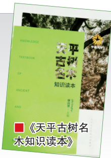
■《天平古树名木知识读本》