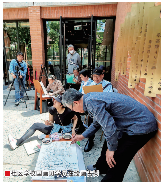
■社区学校国画班学员在绘画古树