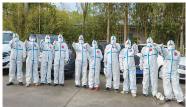
封控期间，居住在崇明区的部分人群需要就医配药的问题逐渐浮现，特别是有些特殊药品只能在市区才能配到，如果无法打通从崇明到市区近百公里的“配药通道”，不少病患将面临断药风险。

为解决这一问题，崇明区在中兴镇振业路路口设立了两个临时搭建的集装箱房，这里承载着全区区外代配药的重任，是“疫期帮依忙”行动专为破解区外配药难题而设立的临时“中转站”。每天，志愿者们从这里出发，跨江到市区为居民代配药，再由各乡镇村居志愿者送达患者手中。