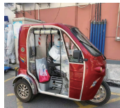
对已年届六十的他们来说，结束一天的志愿服务时已是疲惫不堪，虽然腿脚酸胀，心里却从未萌生退意。这群特殊的战斗者和千千万万的志愿者们一样，在战“疫”一线发光发热，为抗疫贡献自己的力量。抗击疫情，广大残疾人也一起共同守“沪”，构筑健康屏障，用坚持和守护，共同打赢大上海保卫战。

社会在发展，学校教育形态也需不断变化、调整，来与之相适应，唯有不变的是搞好教育所需的办学定力：坚持正道，始终如一。从而让学校教育的有效变化在全体“三小人”的积极应对中自然发生，在促进学生全面而有个性发展的同时，收获美好的教育生活。