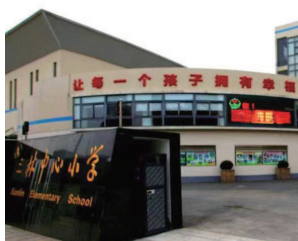
自我认识，提升核心素养，获得生命成长。

定心——育德启智，把握课程教学本质 课程是育德启智的重要途径，学校着力构建具有“贞固”文化特质的课堂教学环境，打造有道德的课堂、有生活的课堂、有对话的课堂、有探究的课堂，让课堂学习的过程成为学生心灵成长之旅，让每一个孩子收获自信，同时发展