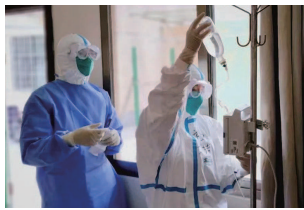
本已是万物苏醒、花木吐绿的时候，但疫情的暴发，给上海人民带来了一场前所未有的“倒春寒”。随着疫情的进展，封控时间的延长，社区居民的就医、配药、随访……一系列问题接踵而至。

进驻中兴镇区外助医志愿服务站的第一时间，前方志愿组便成立了“疫期帮依忙”助医志愿服务队临时党支部，前方志愿组共集结了6名区级机关志愿者以及10名亚运出租车驾驶员，根据工作需要，共细化设置了市区代配药、车队管理、材料交接、药品核对、防疫物资保障、备用金管理、药品消杀等志愿岗位，落实一人一岗、专岗专责，为前方志愿组的高效运转提供了坚实基础和机制保障。