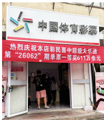
图中中出大乐透第26062期一等奖的崇明区19046体彩幸运网点