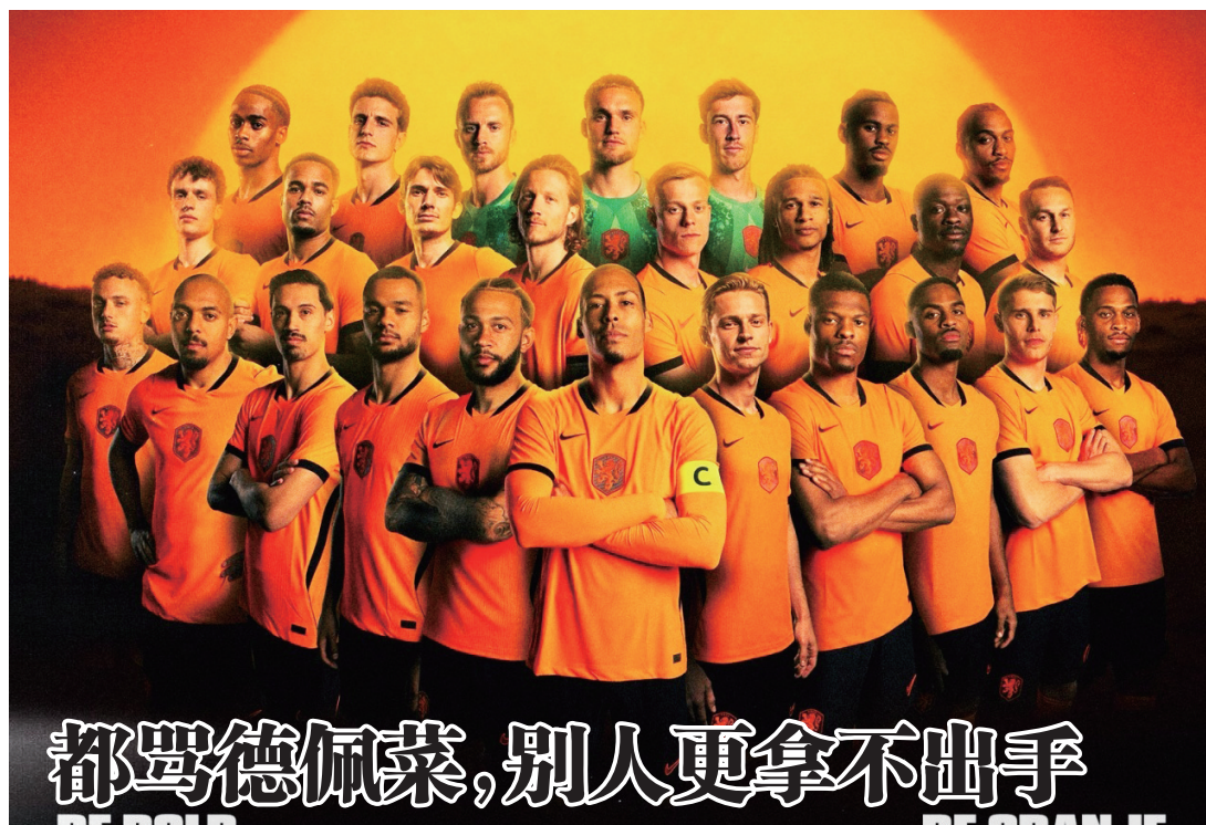
都骂德佩菜，别人更拿不出手

科曼的合同将在世界杯结束后到期，按照主教练的说法，球队当然要为赢得世界杯冠军而竭尽全力，但如果做不到，打进四强也是能接受的，低于这个成绩大概率就不会再续约，他已明确表示自己不会再去执教俱乐部，如果离开荷兰队，未来或许会去接手另一支国家队。