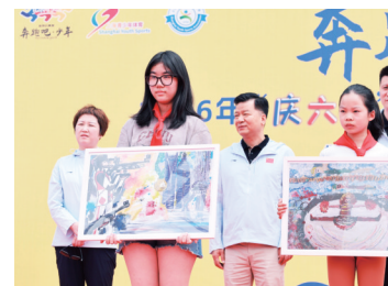
爱心宝贝公益市集义卖孩子们的手作与画作

本次活动也是2026年上海市第十八届运动会前夕一次重要的预热。随着市运动会脚步日益临近,全民运动的氛围持续升温。上海将继续深耕青少年体育事业,不断完善公共服务体系,推动体教融合走深走实,让更多少年儿童爱上运动、享受运动,为建设全球著名体育城市、助力体育强国建设积蓄蓬勃的青春力量。