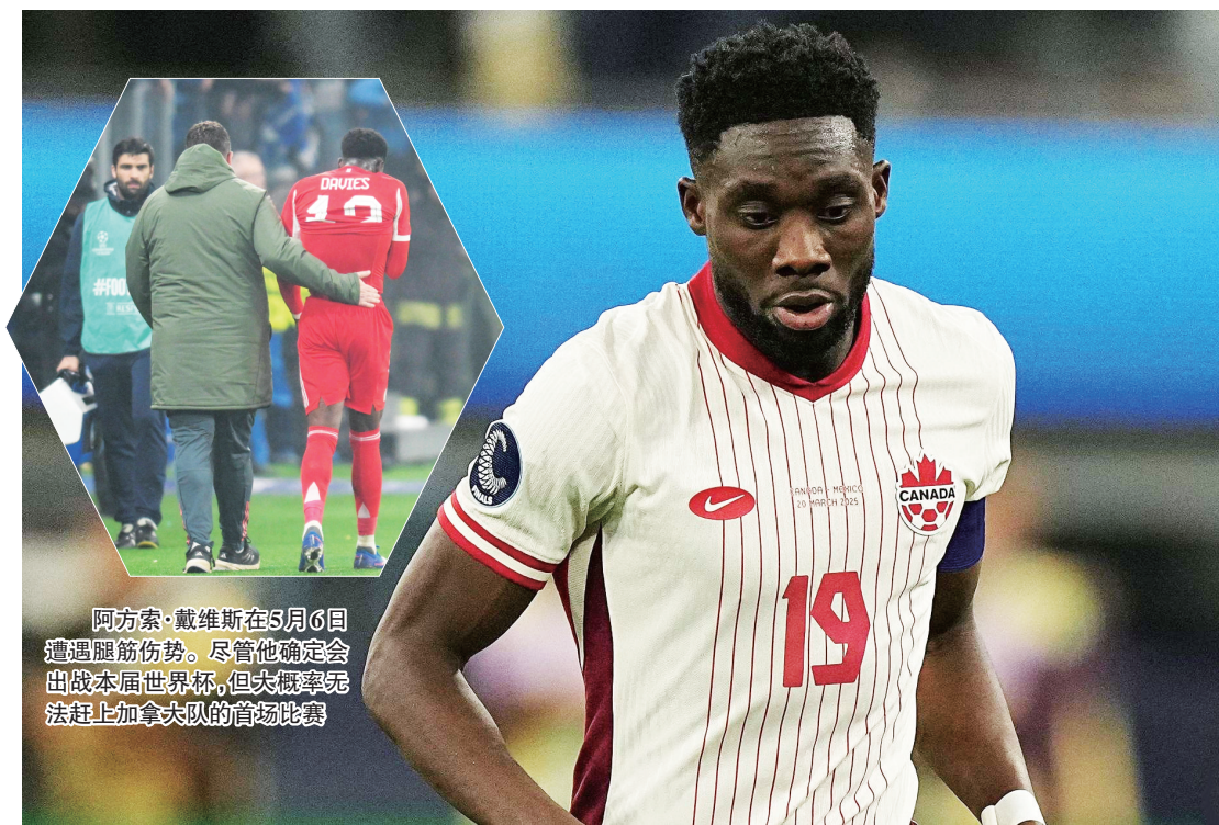
阿方索·戴维斯在5月6日遭遇腿筋伤势。尽管他确定会出战本届世界杯,但大概率无法赶上加拿大队的首场比赛

6月13日 03:00 加拿大 VS 波黑 6月14日 03:00 卡塔尔 VS 瑞士 6月19日 03:00 瑞士 VS 波黑 6月19日 06:00 加拿大 VS 卡塔尔 6月25日 03:00 瑞士 VS 加拿大 6月25日 03:00 波黑 VS 卡塔尔