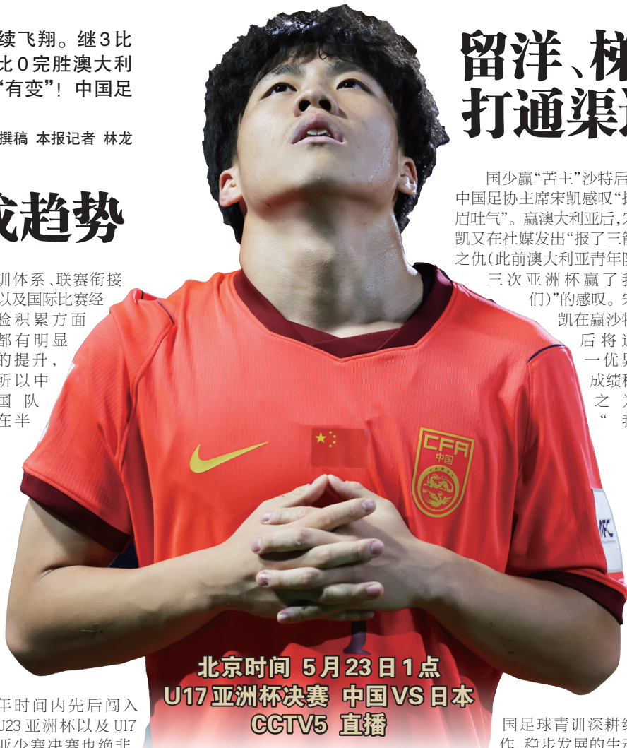
北京时间 5月23日 1点 U17亚洲杯决赛 中国 VS 日本 CCTV5 直播

以中国目前的经济水平而言,去海外踢球的孩子会越来越多。但海归也好,校园足球也好,职业梯队也好,都有其独到的优势。三股力量如能开展良性竞争,并互通有无,这会让中国青训更如虎添翼,步入发展的快车道。如今这支U17的成功已足以证明。