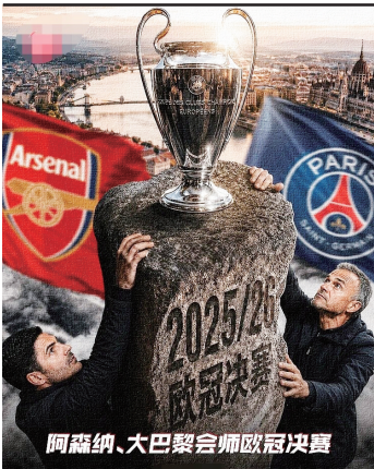
阿森纳、大巴黎会师欧冠决赛