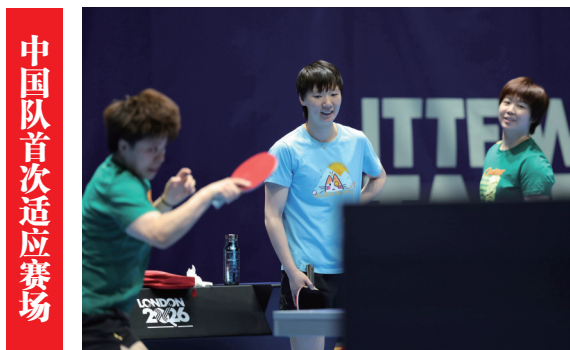
中国队首次适应赛场