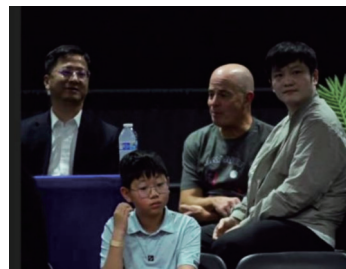
樊振东与中国驻旧金山总领事张建敏（左一）一同看球