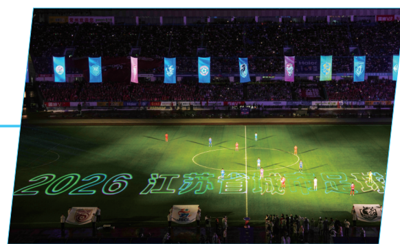
苏超拉开了新赛季的大幕