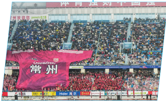
常州队爆出苏超第一大冷