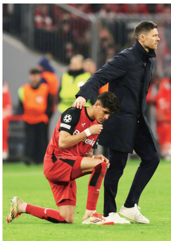
哈里·阿隆索作为主教练第七次对阵拜仁并首次输球

下回合会有奇迹吗？阿隆索曾经历过2005年那场著名的欧冠决赛（AC米兰半场三球领先利物浦，下半场利物浦连进三球扳平，点球大战胜出）：“比赛还没结束，只要还有机会，我们就必须竭尽全力，三球的劣势是否不可逆转？足球场上你永远不知道会发生什么，有时候只要一个进球，就可能改变一切。”