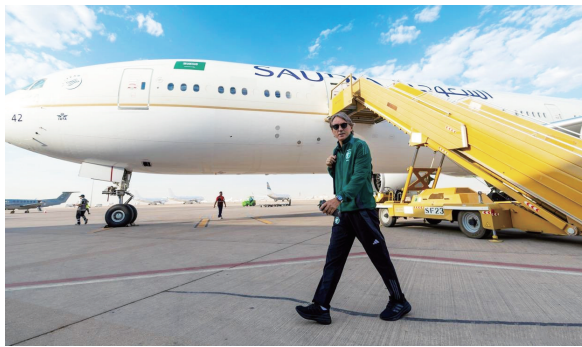
时间 致许多年轻球员无法获得足够的比赛 俱乐部限制了本土球员的发展机会,曼奇尼认为沙特职业联赛中的俱

不过,沙特媒体指出,曼奇尼更应该专注于如何制定适合现有球员特点的战术体系,而不是将国家队成绩不佳归咎于联赛政策或外援数量。曼奇尼作为主教练,需要更加积极地优化战术体系,提高球队的整体战斗力。只有这样,沙特队才有可能在未来的比赛中取得更好的成绩,实现晋级2026年世界杯的目标。