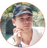
老鬼 知名足彩培训师