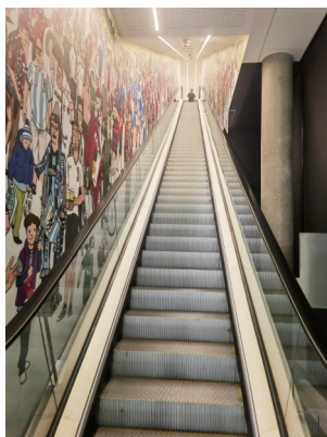
博物馆入口处的扶梯,边上是历史上各德国俱乐部、国家队的著名人物卡通图;博物馆入口处电梯上来后模仿的球员通道;两边是模拟的球迷欢呼摄影媒体