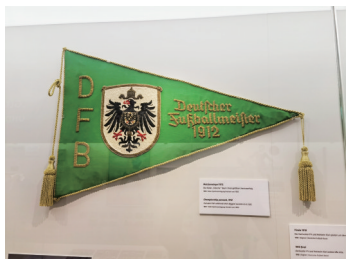
1912年基尔俱乐部赢得全德国足球冠军的纪念