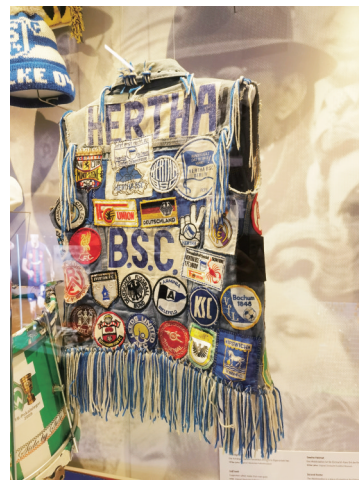
德甲历史上有名的一件球迷外套,上面记录着主人随队出征过的所有对手