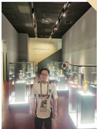
上世纪德甲成立之前德国足球联赛历史