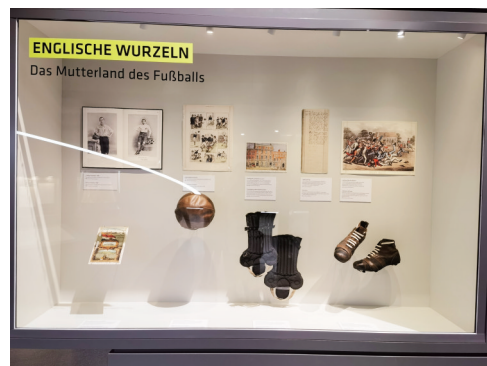
对英国足球的尊敬——足球起源于英国