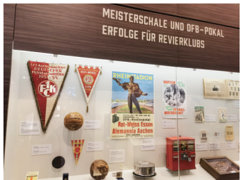
德甲联赛诞生之前的全国冠军(包括凯泽斯劳滕,埃森等俱乐部)