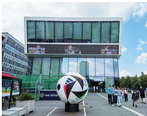
德国足球博物馆正门,前面是巨大的本届欧洲杯使用球