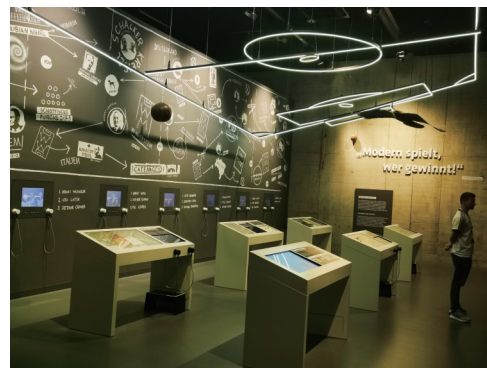
足球战术室——“踢得更先进者方能获胜——奥托·雷哈格尔”,左侧黑板上是足球发展史上出现的所有战术体系

这句话代表了德国人对足球的爱。因为爱得深沉,所以对历史才如此重视。只有厚积,方能薄发。