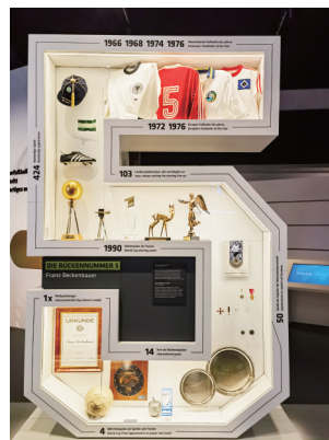
以5号的框架来纪念(背后号码5号的弗朗茨·贝肯鲍尔)