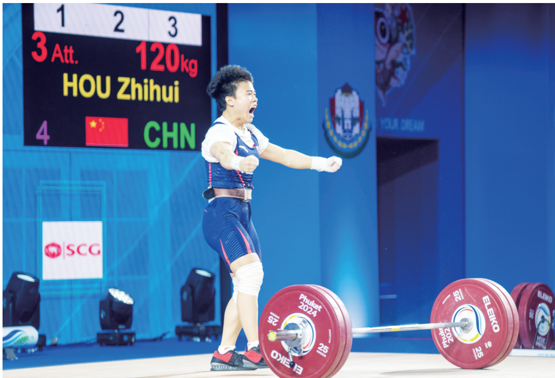
侯志慧在比赛中庆祝