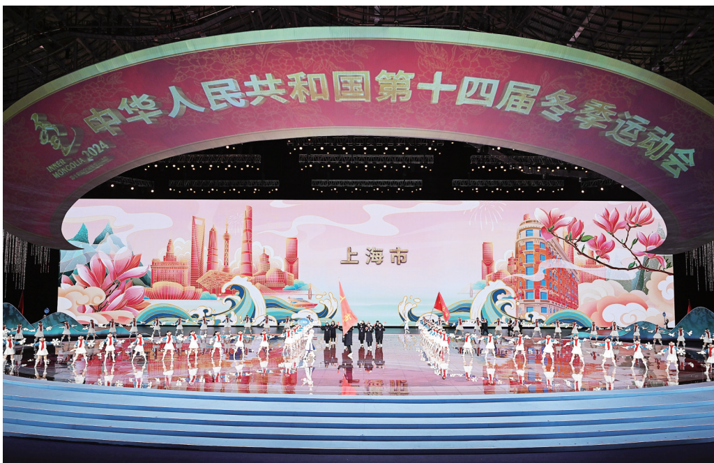
上海市体育代表团在“十四冬”开幕式上入场

“青年组”不仅是申城冰雪健儿取得突破的关键词,也是“十四冬”的关键词。自全国冬季运动会创办以来,这是赛会历史上第一次全面对标冬奥会设项,并增设青年组。对缺少天然冰雪资源、冰雪运动起步较晚的上海来说,这增设的青年组恰好为在北京冬奥春风中成长起来的新秀们提供了实战良机。