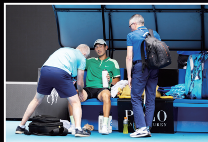
商竣程右大腿拉伤