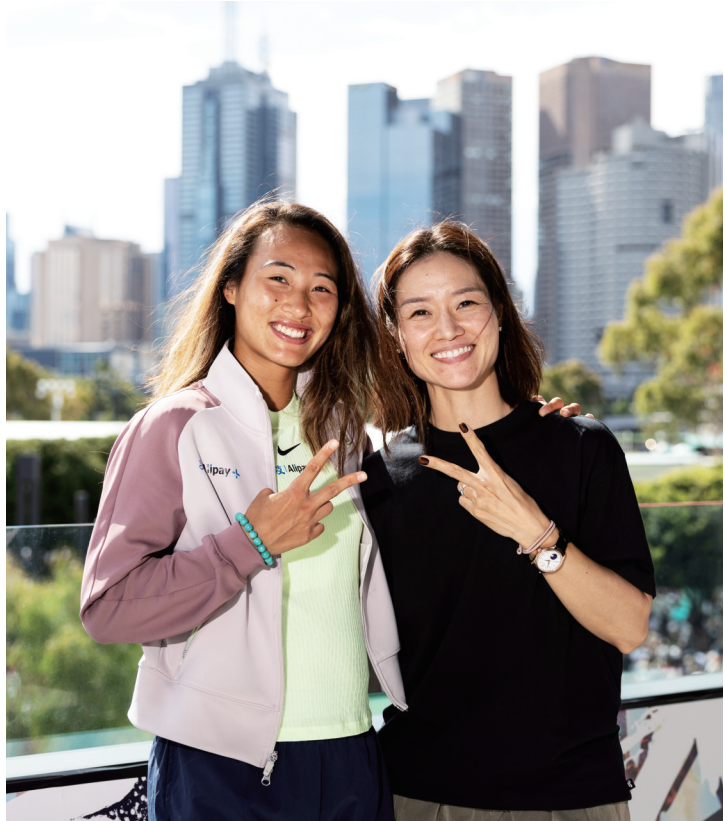
郑钦文(左)与李娜在墨尔本合影

赛后，李娜心情特别放松，“我在这里有非常好的成绩，十年前我成功在这里夺冠，所以有非常多美好的回忆。”谈到这次的团队，李娜自信幽默地说：“问题还是一样，我老公还是那一个，我们还是那么相爱。”此后，李娜还将搭档2002年澳网男单冠军约翰松，出战澳网元老组混双比赛。