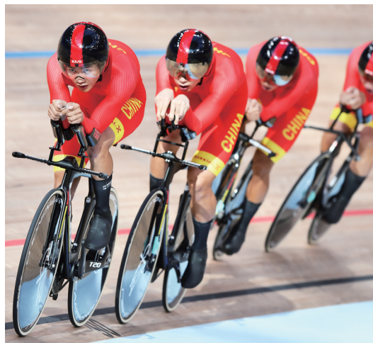
男子场地自行车追逐赛团体赛进行中